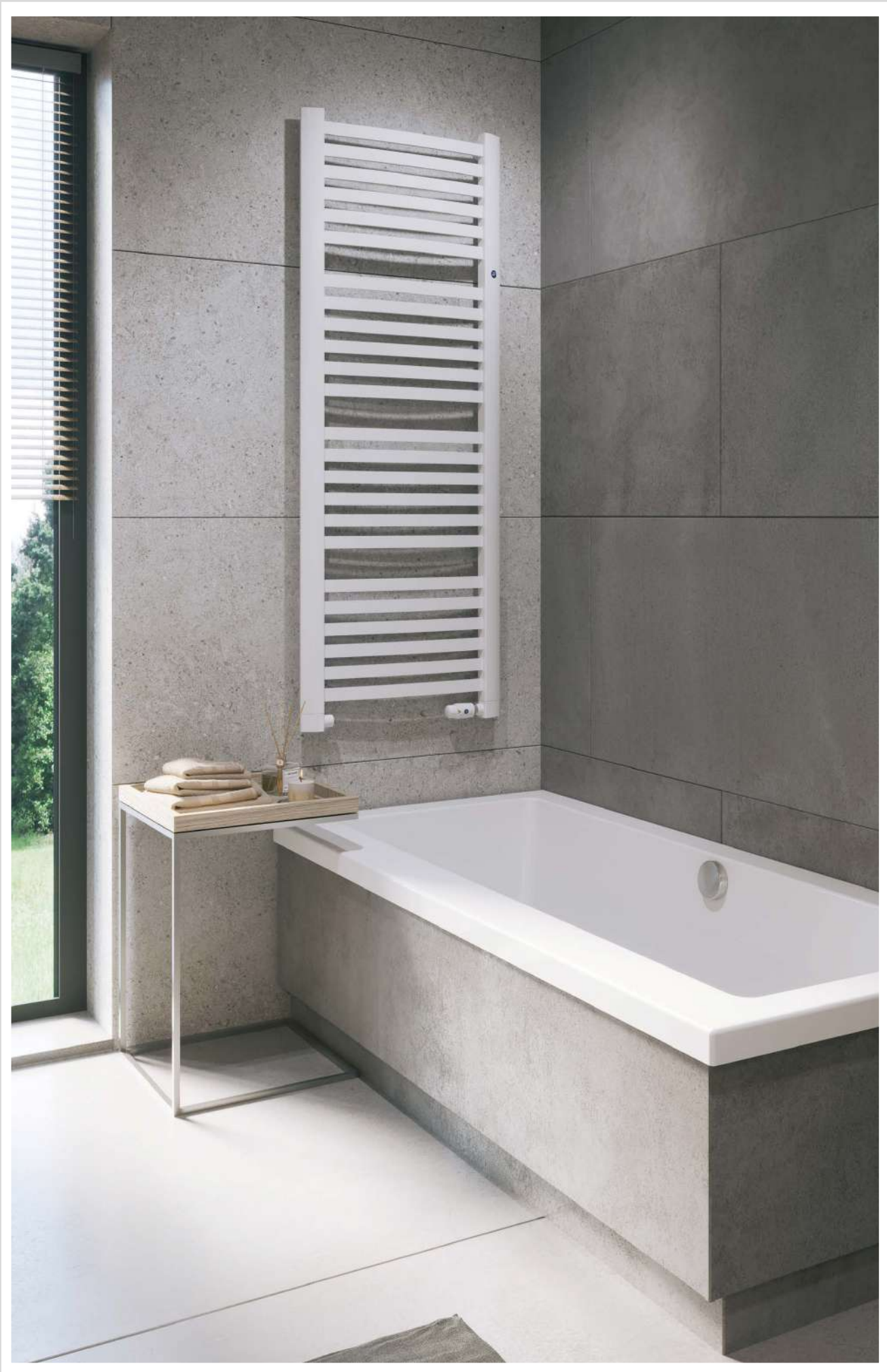
Na aranżacji: grzejnik c.o. RET-50/140, zestaw zaworowy Z17 In the visualisation: RET-50/140 heating radiator and Z17 valve set