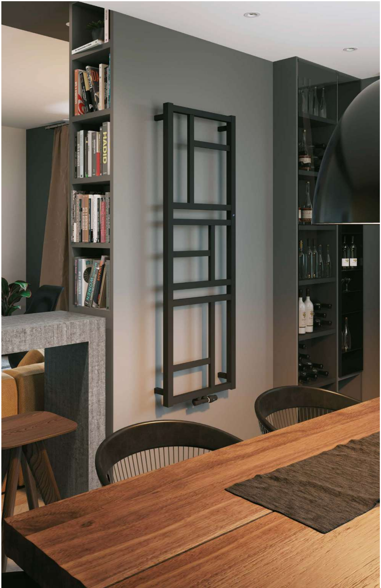
Na aranżacji: grzejnik c.o. MON-60/170D50C31, zestaw zaworowy Z15 In the visualisation: MON-60/170D50C31 heating radiator and Z15 valve set