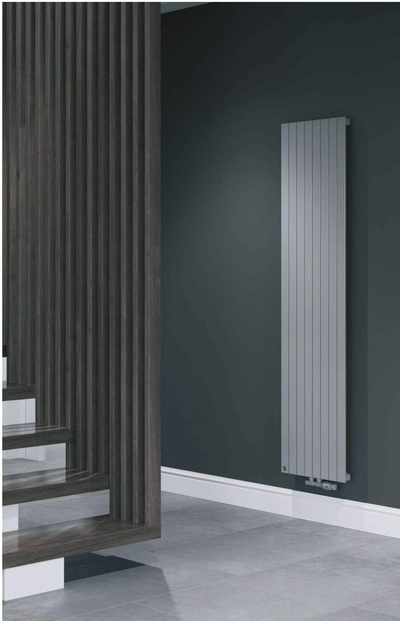
Na aranżacji: grzejnik c.o. COVNV-180/08C71, zestaw zaworowy Z15 In the visualisation: COVNV-180/08C71 heating radiator and Z15 valve set